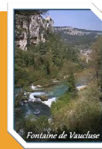
Fontaine de Vaucluse